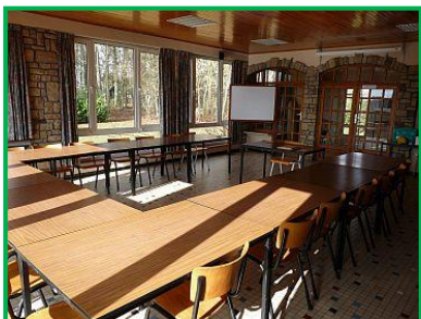
Une salle de réunion