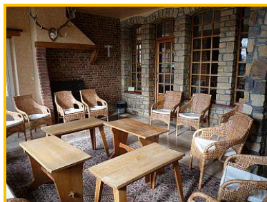
Le petit salon

Possibilité de participer à la prière de la communauté à 8h00 (Laudes) et à 18h30 (Vêpres-Eucharistie)